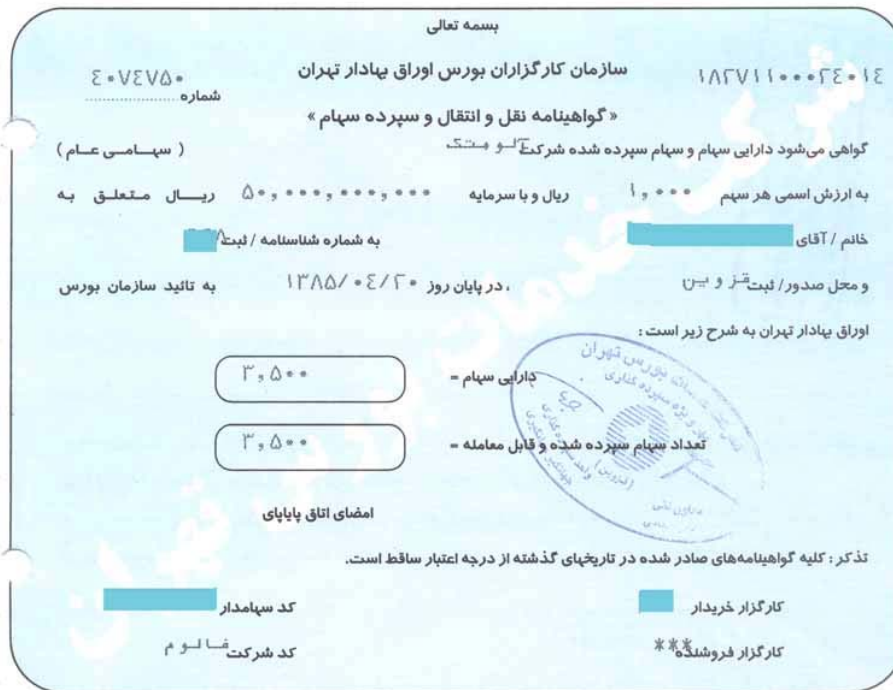
نمونه گواهینامه نقل و انتقال سهام - تالار اصلی