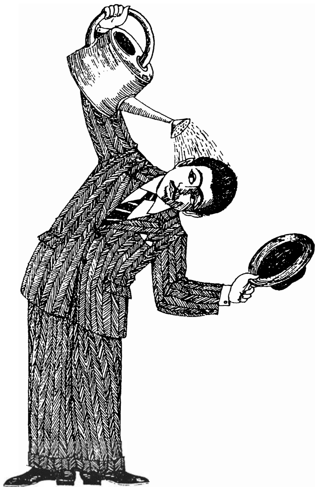
سروگوش آب دادن