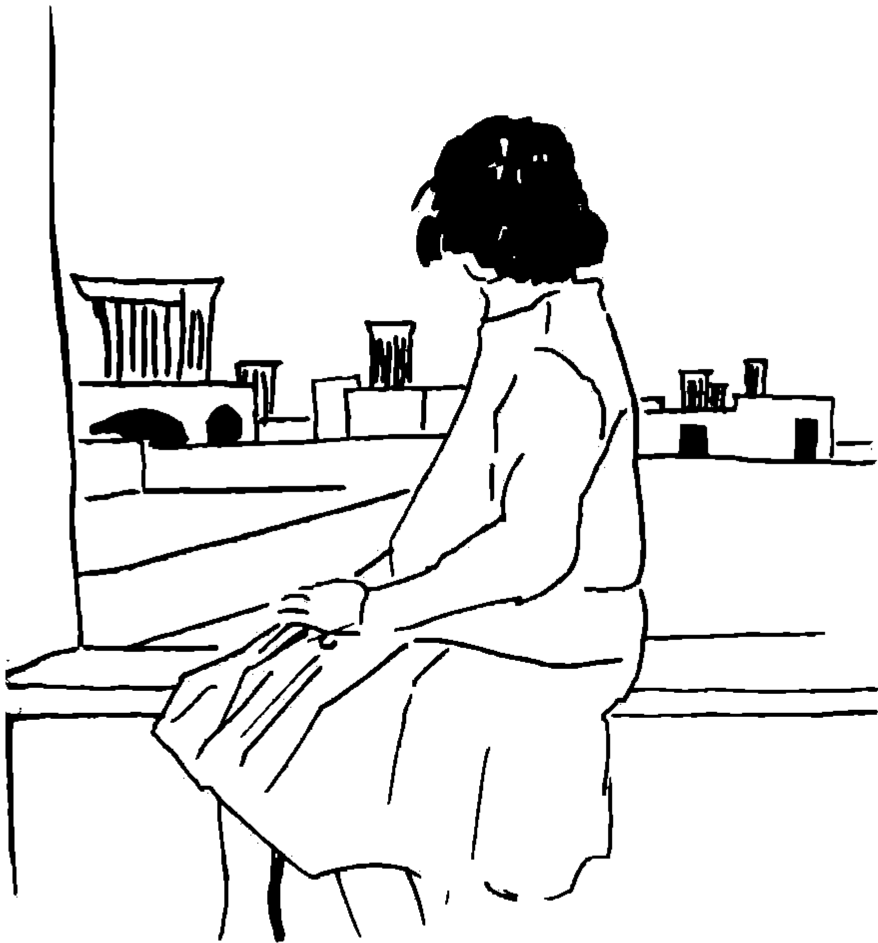
طرحی که سهپری از مادر خود ترسیم کرده است