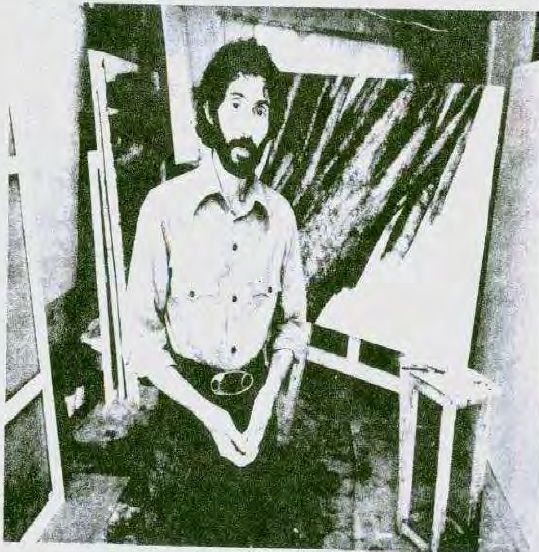
سپهری در کارگاه نقاشی خود (خرداد ۱۳۴۸)