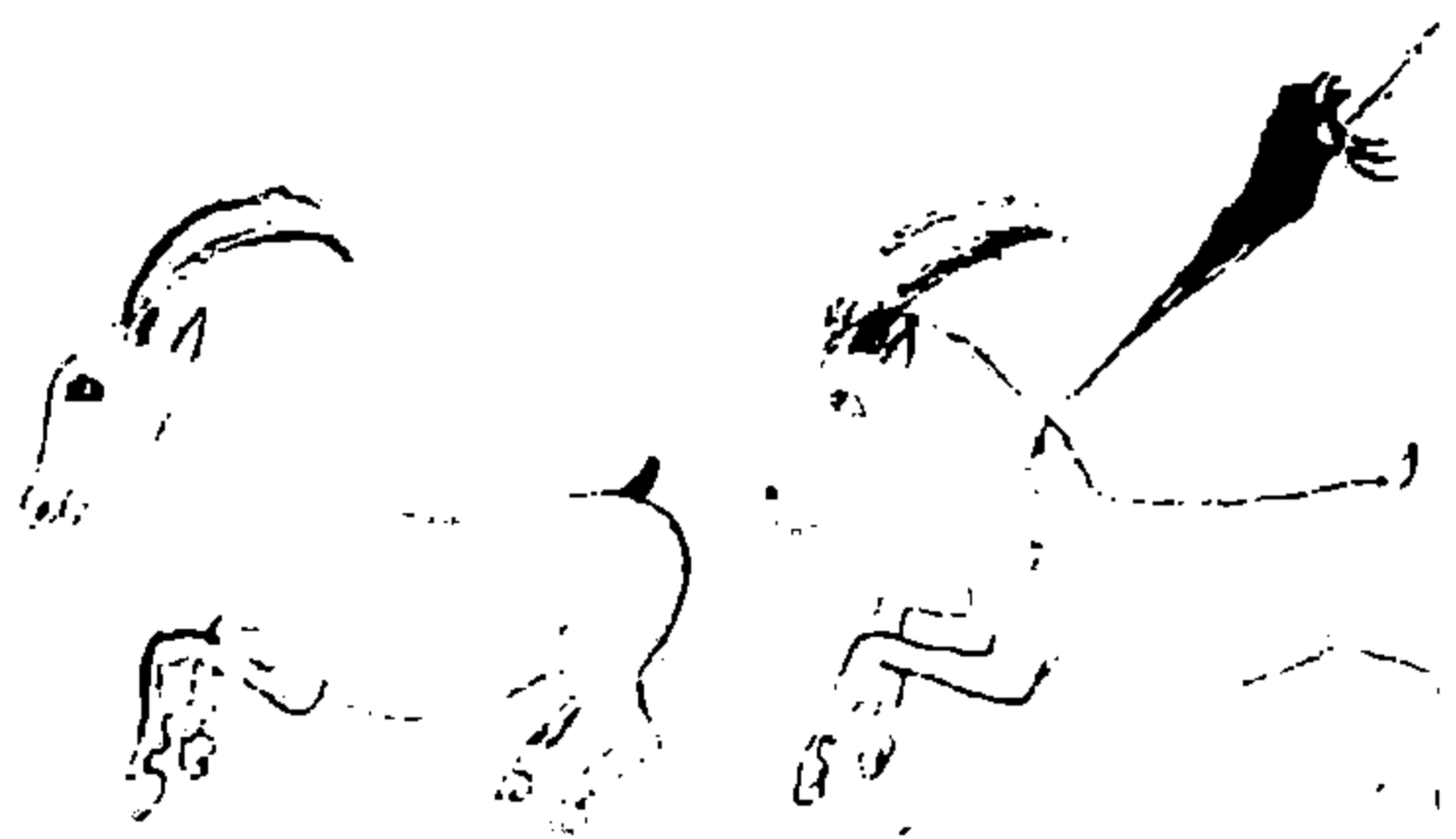
طرح به قلم پندر مؤلف، اسطافه سهری