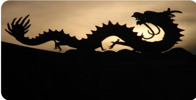
عکس پنجم اژدها

هوا که وقتی ذراتش گرد هم می آیند غلیظ می شوند و به صورت ابر در می آیند و وقتی ذرات از هم جدا می شوند لطیف می شوند و دیده نمی شوند